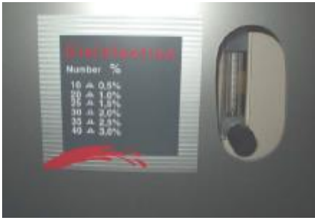
Flowmeter med koncentrations tabel