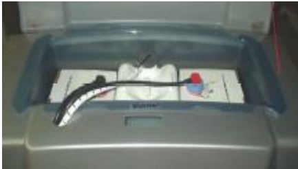
Boks til plejemidler og desinfektion